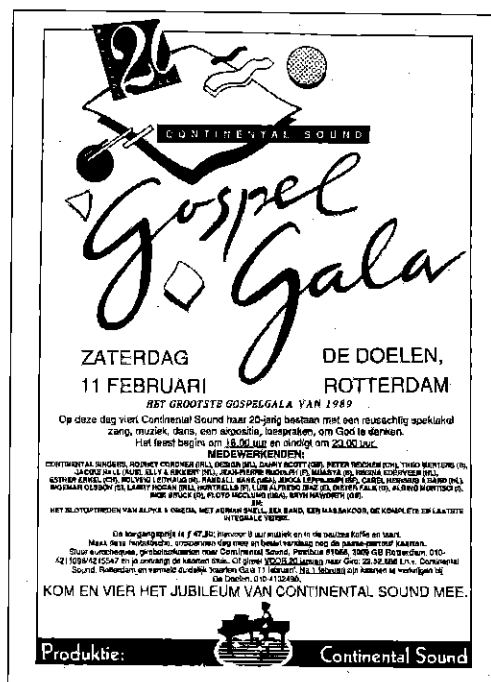
Poster van het 20-jarig jubileumgala