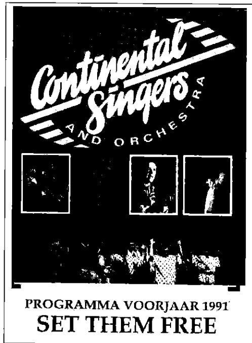
Programmaprogramma Continental Singers