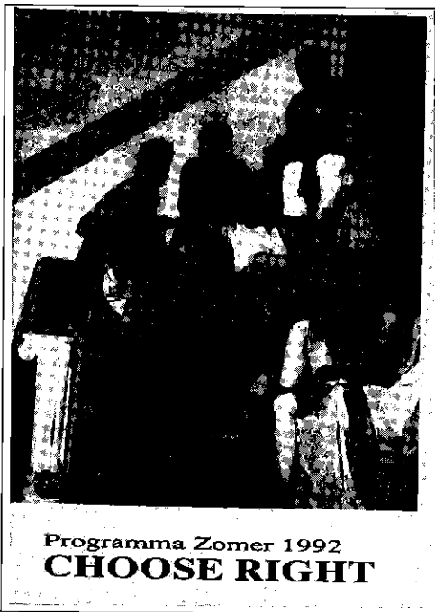
Programmaprogramma van de eerste Young Continental groep

1992 Continental Singers: Dertien USA-parallel zomertours. Zes naar Europa. Twee voorjaarstours (1 naar Europa). Twee herfsttours (1 naar Europa). Twee Young Continental tours. Europa: 5 Internationale C.S. (Euro-Holland; waarvan 1 Frans en 1 Duits), 4 U.K. groepen, 1 Hongarije groep. Europa: eerste tour 1 Young Continental. Andere werelddelen: Japan, Puerto Rico (2), Nieuw Zeeland, Korea, Singapore, Chili. Continental Sound: Adrian Snell en een nieuwe Passion-tour, Expressie, Christian Artists Directory, muziekuitgeverij: Bits & Pieces; Quacks (Ria La Rivière), computer-systeem wordt vervangen door nieuwe multi-user, St. Licentie, Discipel, Jonicongres, Christian Artists Seminar en tweede vaksymposium, Art 2000 Vol. 1, Merv & Merla Watson, Music & Art wordt geherstructureerd.