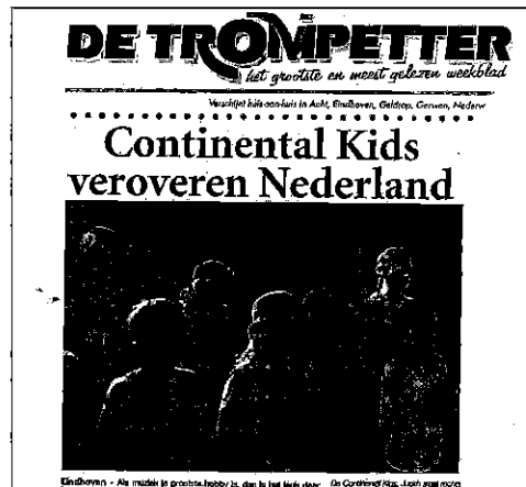
De Continental Kids kregen opnieuw veel aandacht in de media