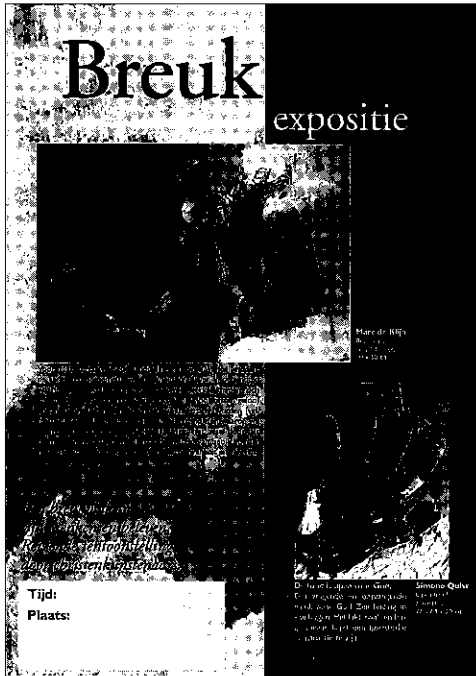
De tentoonstelling 'Breukvlak' met werk van leden van de CABK werd opgestart.