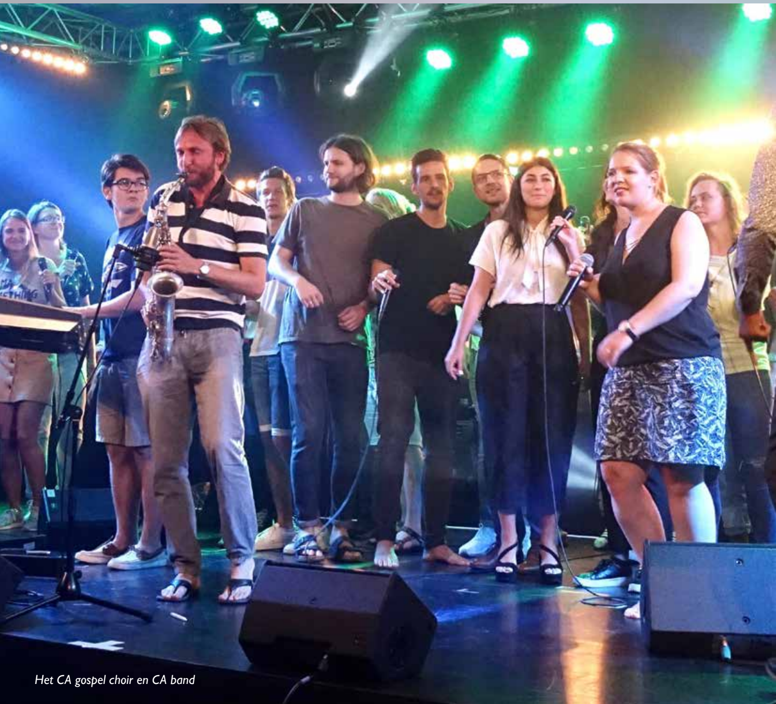
Het CA gospel choir en CA band

Is de voortzetting van Gospel Music Magazine, Music & Art, Bottomline en SIGNS