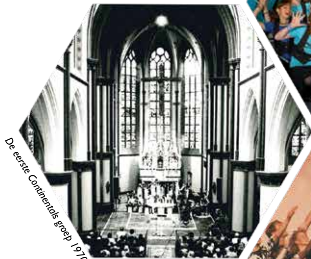
De eerste Continentals groep 1970