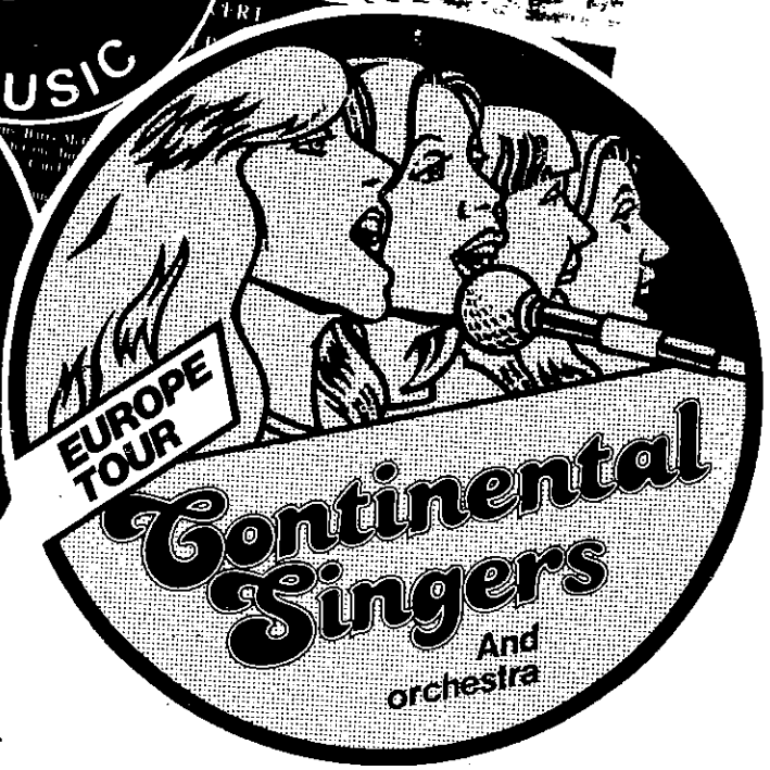
nieuwe vignetten en nieuwe stickers