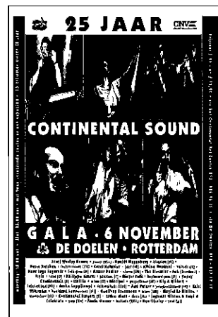
Poster voor het Gala