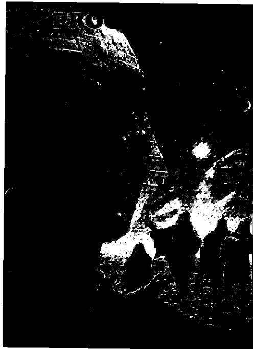
Programmaboek Musical Dreamer