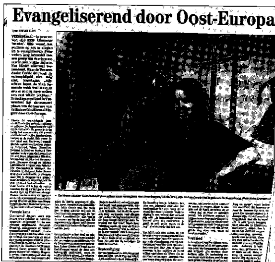
Kranten artikel uit Veenendaal