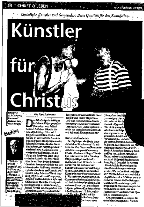
Artikel over Christian Artists in het Duitse magazine Idea

Continental Sound: Diverse boeken-uitgaven (Koninkrijk van Gerechtigheid, Expressie, Snufjes, Art 2000 Vol. 5); 20-jarig jubileum van Discipel met muziektheaterproject + CD: Het is Tijd. Music & Art, Sjofar, studiedagen, St. Licentie. St. Ev. Lied, CNV-Kunstenbond, aansluiting bij Federatie van kunstenaarsverenigingen, Eerste basiscursus Muzikaal Leiderschap (CAMM). Christian Artists Symposium.