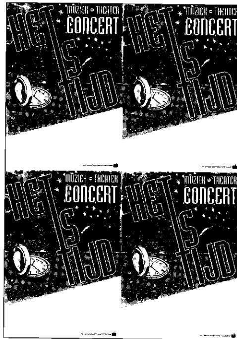
Flyers van 'Het is Tijd' theaterprogramma van Discipel