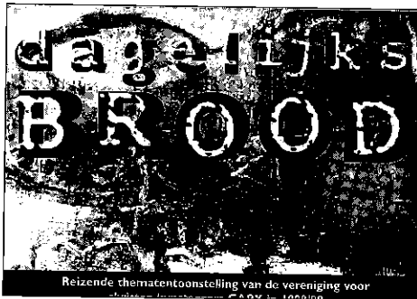
Folder van de eerste CABK Tentoonstelling 'Dagelijks Brood'

Vorig jaar kwamen de plannen op tafel voor Conti Kids. Dit project ging met Maarten van start, en is in 1999 o.l.v. Rob en Lineke de Jong verdergegaan. Ik weet nog goed hoe Leen en Willem dit plan lanceerden. Ik vond het een goed plan, maar ook een plan, dat goed uitgewerkt moest worden. Met jonge kinderen werken, is niet niks. Een hele grote verantwoording. Op 8 september wordt onze kleindochter geboren, Roxy is haar naam. Ik kan het niet geloven, na 3 zonen en een kleinzoon. We zijn dankbaar!