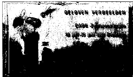
Folder van de eerste CABK Zomeracademie