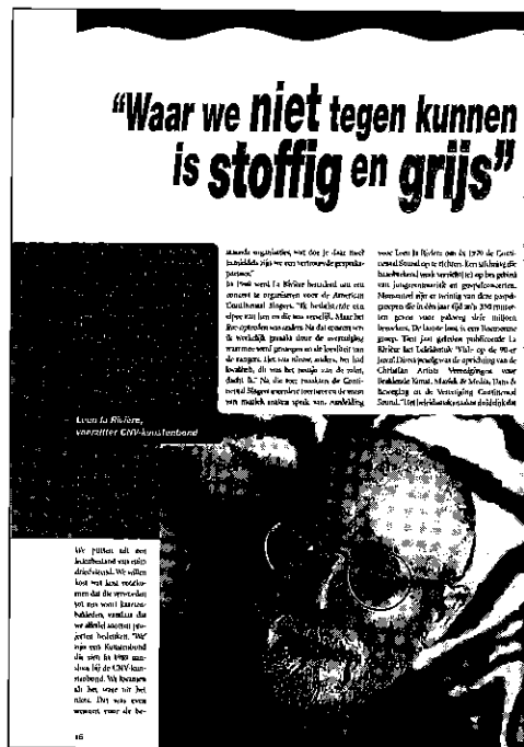
Interview in het magazine van Buma/Stemra