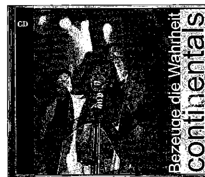
Bezeuge die Wahrheit, German Continentals